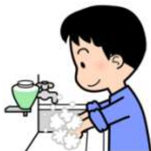
せっけんでしっかりあらう