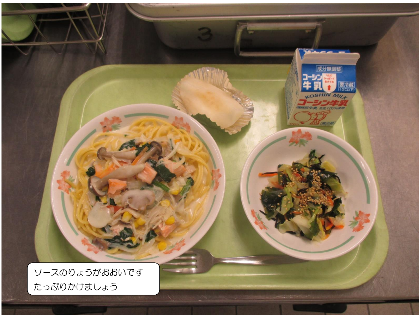
ソースのりょうがおおいです たっぷりかけましょう