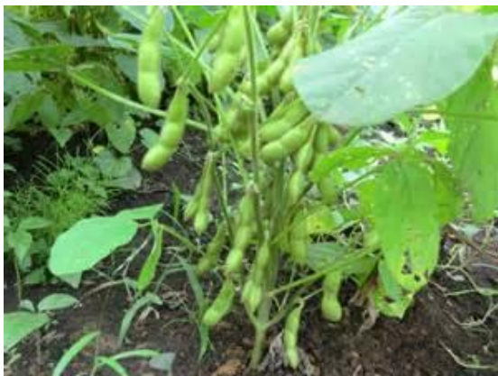
はたけになっているようす