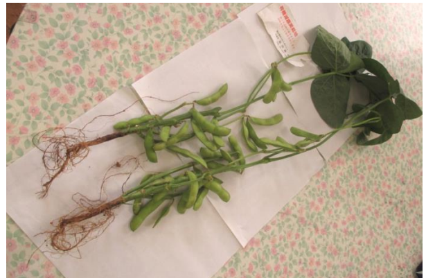
えだについたじょうたいのえだまめ