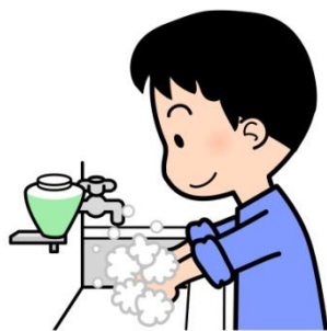
せっけんでしっかりあらう