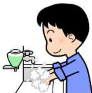
せっけんでしっかりあらう