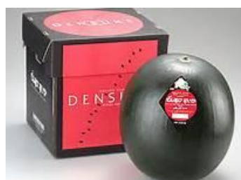
まっくらなでんすけすいか