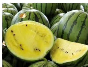
なががきいろいすいか