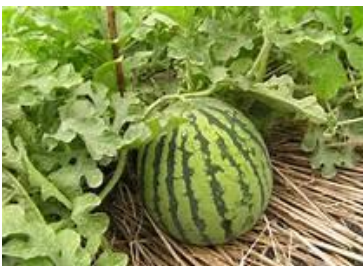
はだけになっているようす

すいかには、種類がたくさんあります。スーパーやおやさんなどに行ったら、さがしてみましよう。