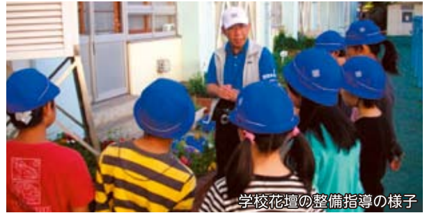
学校花壇の整備指導の様子

日々の授業や行事、環境や安全に関する取り組みへの地域・保護者の方による支援活動が大変充実しています。児童と委員との交流も日常化しており、地域をより身近に感じる児童が増えました。さまざまな活動を通して、児童が地域への愛着や誇りを感じるようになりました。