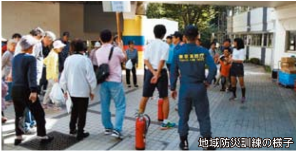
地域防災訓練の様子

地域防災訓練へ中学2年生が参加しました。当日はたくさんの方々に来ていただき、生徒たちは地域防災訓練の多くに携わることができました。地域の方から「訓練に中学生が多数参加したことで活気があった」「いざという時に地域の力になると感じた」との言葉をいただき、充実した訓練を行うことができました。