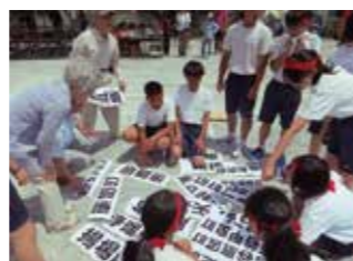
運動会における地域協働学校の競技種目 (学区にまつわるクイズに地域の方と協力して答える競技)

学校行事に地域の方々に加わってもらうことが多くなり、地域との結びつきが強くなりました。これまでの地域レクをさらに発展させるとともに、学校が拠点となって明るく活気ある地域となるよう取り組んでいくことが目標です。