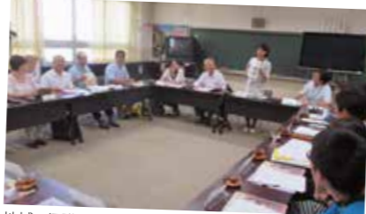
地域、保護者、学校が同じ気持ちで取り組んでいます。

運営協議会には、委員と共に全教員が参加しています。教員を含めたメンバーは、学習、環境、安全の3つの支援部のうち1つに所属し、子どもたちのためという共通の姿勢で話し合いをしています。