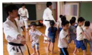
わくどきサマーセミナーの様子(空手教室)

地域、保護者の方が講師になり、子どもたちが様々なことを体験しながら学びを深める「わくどきサマーセミナー」を始めました。「バルーンアートづくり」「江戸落語を聴く」など25の講座が開催され、子どもたちが楽しく学びあう夏となりました。