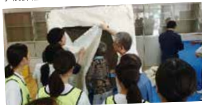
地域防災訓練の様子

学校・家庭・地域の三者が相互信頼に基づいた「新たな関係」を創り上げていくことを目指して、①地域行事や地域防災に関すること②職業体験等地域の事業所との連携に関すること③学校評価に関する取り組みをしています。