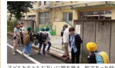
子どもたちもお互いに顔を覚え、町であった時にも「こんにちは」と笑顔が返ってきます。

月1回の協議会には先生や児童が参加することもあり、学校全体で地域協働に取り組んでいます。準備校の時から実施している「朝のあいさつ運動」が浸透し、通勤の方からも声をかけられる場面も出てきました。