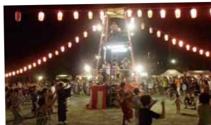
盆踊り大会の様子

地域の中に入り、地域とともに歩む地域協働学校を目指しています。その一環として、昨年度から地域の盆踊り大会に教員グループが出店し、また、子どもたちと一緒に踊っています。こういったお楽しみ企画もいろいろあります。