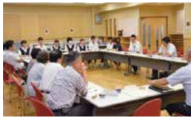
学校運営協議会の協議の様子

学習指導、生活指導、キャリア教育の各系に分かれて、学校の分掌に対応した具体的な取り組みを行っています。生徒会役員や全教員との意見交換、授業参観等で学校運営に携わり、四谷の子は四谷で育てるをモットーに運営を行っています。