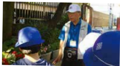
環境整備指導の様子

学習・読書・安全・みどり(環境)・学校評価・連携の計6つの支援部での取り組みは、日々の教育活動に欠かせない力となっています。また、保護者の参画意識も高揚しています。地域美化等の新たな課題に対応するため、さらなる連携強化に努めています。