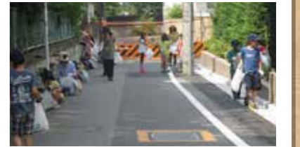
クリーンアップ仲之の様子

心豊かな子どもたちの健全育成をめざし、地域や保護者の方々とともに全校児童による地域清掃「クリーンアップ仲之」や、赤い羽根や歳末助け合いで子どもたちによる募金活動などを行っています。