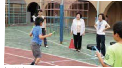
わせだギネスディにおけるスポーツ支援の様子

早稲田学(学習)支援、読書活動支援、スポーツ支援の3つを柱に、子どもたちの安全と成長を多くの目で見守っています。近隣からの温かい支援に事欠かない早稲田では、子どもも大人も顔見知りの笑顔溢れる地域を目指します。