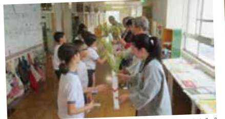
みどり支援部の協力のもと取り組んだ「鶴巻たんぼプロジェクト」。無事に収穫をし、地域の祭りで稲を使っていたけました。

今年度からは3つの支援部(みどり支援部・行事支援部・子ども支援部)を立ち上げ、活動しています。学校・保護者・地域が一体となり、健やかな子どもの育成に向けて活動しています。