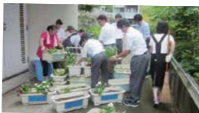
フラワーラインに向けた準備の様子

春・秋の年2回、校舎周辺道路を花で飾る「フラワーライン」活動に取り組んでいます。今年より地域の方にご協力いただき、植え替えの準備作業や当日の植え替え作業も生徒と一緒に進めています。