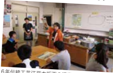
6年伝統工芸江戸木版画の授業

毎日の校門あいさつや定期的な音読学習支援など、児童の健全育成に向けた頼もしい応援として御尽力いただいています。授業、実演、体験活動等して毎日を生き抜いていくエネルギーをもらっています。