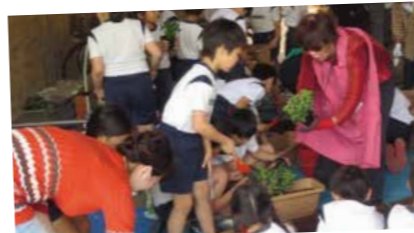
<四谷の街を花いっぱい>その後の水やり等、花の世話まで責任をもって行っています。

3年生は、総合的な学習の時間に「花いっぱい運動」に取り組んでいます。支援組織スマイルクラブの皆さまと一緒に日々草を植えました。後日、子どもたちはプランターを各商店や企業に届け、地域の方々と交流を図っています。