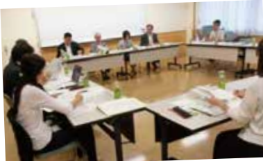
地域協働学校運営協議会の様子

保護者の家庭教育を推進し支援するための話し合いを深めています。今年度は、12月に「大人のためのスマホ教室」を開催し、子どものスマホ利用の実態や家庭で気を付けなければならない点などを学びます。