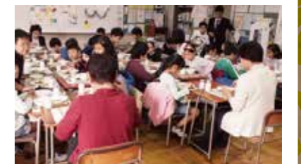
ふれあい給食の様子

「地域でつながる落四」をテーマに、学校公開日の「おちよんカフェ」開設、放課後図書室の開放、地域の高齢者との交流等の活動に取り組みました。学校と地域のつながりを大切に教育を推進しています。