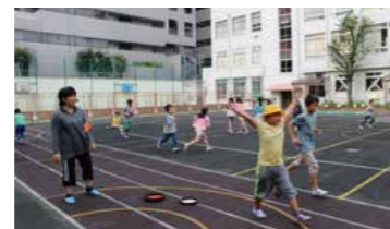
朝元気(朝遊び)の見守りの様子

地域に広くボランティアを募り、「安心・安全支援部」として新通学路見守り隊・白銀公園見守り隊を、「運動・遊び支援部」として朝遊び見守り隊を編成して取り組んでいます。また、授業支援もしていただいています。