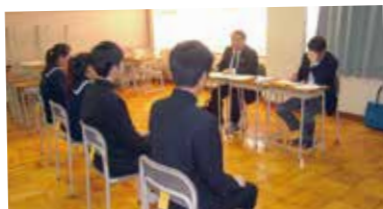
集団面接練習の様子

道徳授業地区公開講座への講師招聘、3年生の集団面接練習、避難所設営訓練など、学校と地域コミュニティの連携の活性化を図り、地域協働学校として地域に根ざした教育活動の充実と深化を目指します。