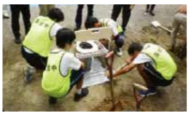
地域防災訓練では専門家の方にアドバイスをいただき、非常用仮設トイレを組み立てました

今年度は①中学生が先頭に立ち活動する地域防災訓練②おとめ山公園を活用し、新宿の自然環境の発信の2つに重点を置いて活動しています。