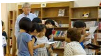
地域協働学校運営協議会委員の人にインタビューする子どもたち

地域協働学校運営協議会では、学校評価の実施とともに、教育活動への意見などを話し合っています。今年度は、委員より新たに落合の染物や禅寺丸柿などの地域学習のアイデア提供や講師の紹介があり、豊かな教育活動の推進に向けて大きな力となっています。