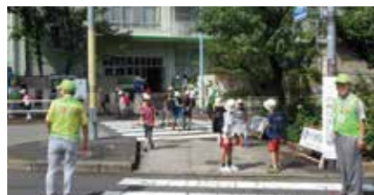
登下校の見守りの様子

安全支援部、図書支援部、園芸支援部、学習支援部の4支援部が積極的な活動を展開しています。運営協議会委員がそれぞれの支援部の活動に主体的に参加することで、地域と学校の距離が近くなっています。