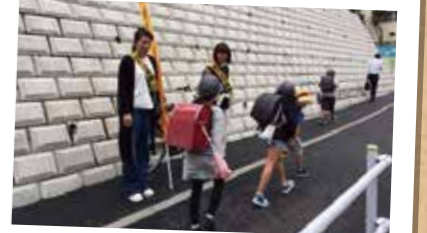
あいさつ運動の様子

あいさつ運動、近隣の高等学校と連携して行ったワクワクスクール、地域の和太鼓等、様々な取り組みのほか、毎月第3水曜日に大久保小とあいさつ運動を行い、笑顔とあいさつの響く地域を目指しています。