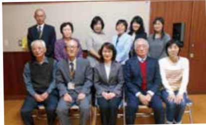
地域協働学校運営協議会委員

学校支援部会を推進するために地域ボランティアの人材発掘や、安全をキーワードとして各町会との連携を図ることが話し合われ、さらなる地域との協働に向けて準備を進めています。