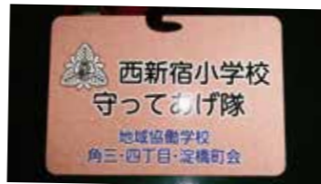
地域の方へ配布した防犯プレート

①首かけプレートの作成と地域への配布、趣旨説明②図書館ボランティアの募集と、朝の読み聞かせの充実(全学級 月2回)③図書室の椅子、机の修繕の3点を実施しました。子どもたちは、プレートをかけている地域の方に挨拶ができるようになりました。