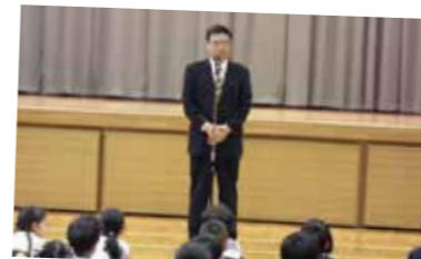
全校朝会での講話の様子

毎月1回、全校朝会で地域協働学校運営協議会の委員の方が講話をしています。地域の願いや学校に対する思い、人生の先輩として子どもたちに伝えたいことを話していただいています。