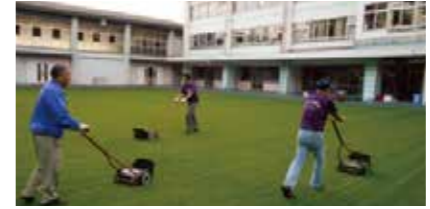
芝の管理はPTAとの連携した活動が定着してきました。

緑支援部、学習支援部、安心安全支援部の3つの支援部会で協働活動を具体的に推進しています。緑支援部では、芝刈りや芝植えなどの芝の管理、季節ごとに花の苗を植えるなどの取り組みを行っています。