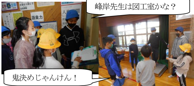
峰岸先生は図工室かな？

今年度のかがやき班活動は9月からのスタートで、遠足も中止になってしまいました。「コロナ禍だからできないこと」を挙げるより、「この状況だからこそできること」はないかと6年生が話し合っって企画し、かがやきロング集会を行いました。1、2時間目を使って、校庭や体育館で班遊びをしたり、校内でスタンプラリーをしたりしました。普段のかがやき集会よりも時間が長く、たっぷり遊ぶことができ、どの子もみんな楽しそうでした。今年度は、感染防止の観点からいろいろな制約がある中で、6年生は下学年のみんなが楽しめるような遊びを考えたり、工夫したりしてくれました。かがやき班活動の回を重ねるごとに説明や進め方が上手になって、自信をつけていく姿はとても頼もしいです。6年生のおかげで、とても楽しい時間を過ごすことができました。