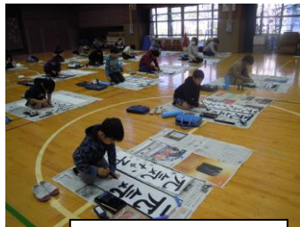
写真は昨年度のもの

1月13日(水)に席書会を予定しています。一文字一文字、心を込めて丁寧に書初めをします。1・2年生は教室で硬筆を、3～6年生は体育館で毛筆を行います。