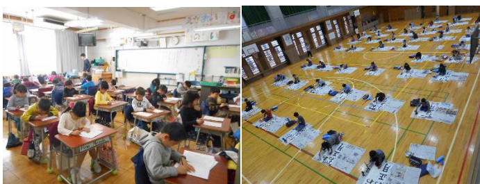
※写真は昨年度の様子

落合地区の小中学校の代表児童生徒の作品が展示されます。こちらもぜひ足を運んでご覧ください。