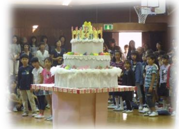
3・4年生作のバースデーケーキ

朝晩に冷え込みを感じる時季となりました。空にはいわし雲。すっかり秋の装いです。さて、2学期の大きな行事「運動会」と「たてわりフェスティバル」が終わりました。運動会では、学年で練習に取り組むことが多くあり、連帯感を高めるよい機会ともなりました。たてわりフェスティバルでは、お兄さん・お姉さんとして年下の子たちを気にかけて、5、6年生の手助けをしたりする姿が見られました。明日から11月が始まります。気持ちのよい気候の中、学習に運動に、自分の持ち味を発揮し高めることのできる時間を共に過ごしていきます。