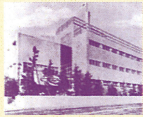
昭和8年完成の現校舎