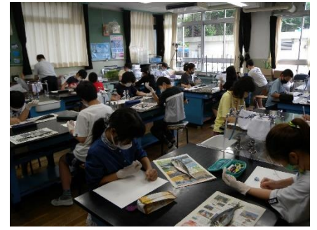
まずはあじのスケッチから