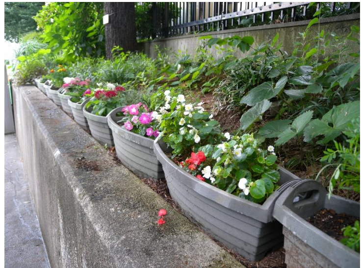
マリーゴールド、ペンタス、日日草の3種類を植えました