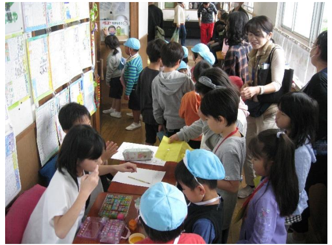
淀四まつり 6年生は1年生と一緒に回ります。幼稚園児も見学しました。

毎週月曜日と木曜日の朝 7:45~8:15に朝遊びを実施していますが、見守りの方が足りません。急に出入りなくなることもあり、現在の3人体制では手薄になります。4人体制にしたいのですがあと少し人手が足りません。保護者の方にもその時間にお手伝いだけいただけたらありがたいです。祖父母の方でも大歓迎です。「お孫さんの様子を見ながらちょっとお手伝い」はいかがでしょう？問い合わせは栗林副校長(3227-2105)まで。