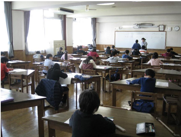
算数検定 今年は6級から11級まで、29人が受検しました。