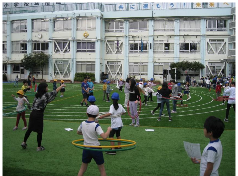
淀四ギネス 結果は職員室前の廊下に張り出されます。お楽しみに！