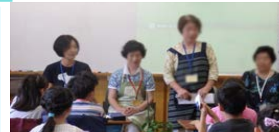
↑野菜名人の授業。↓ダンスクラブ