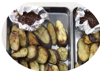
唐辛子味噌と ナス