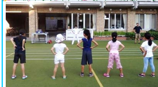
8/1～10 ラジオ体操。毎回100名余りが集まり、元気に体を動かしました。