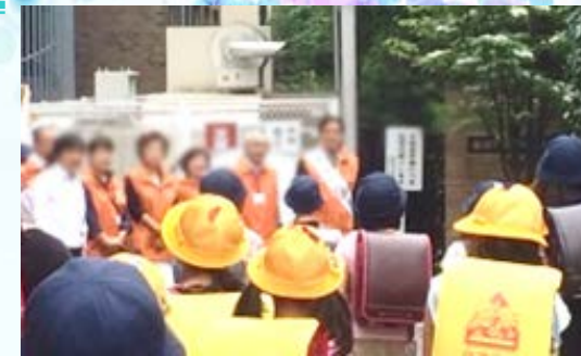
▲吉住区長が1日民生委員として朝のあいさつ運動に来てくださいました。