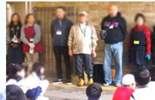
▼2年生：野菜名人と苗を植えました。