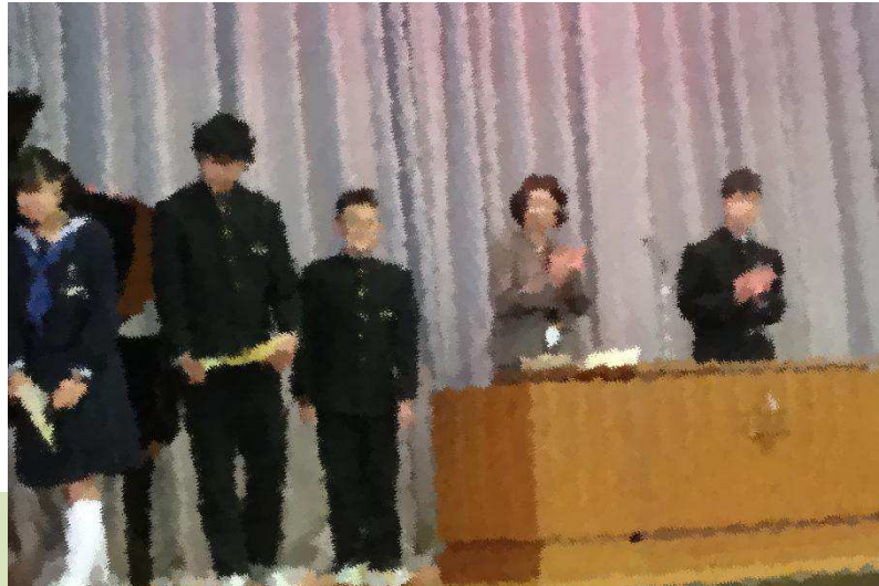
朝礼で校長先生から認定を受けるインストラクター