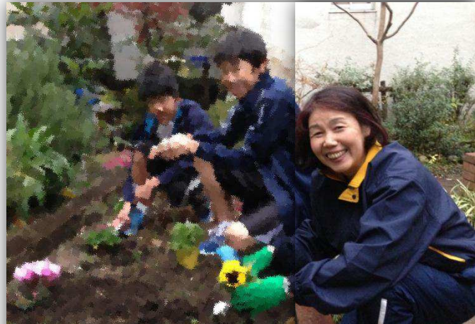
赤沼校長先生もジャージに着替えて参加

この支援を受けて、憩いの中庭だけでなく、沿道の植え込みや通用門にも沢山のお花を植えました。花壇の手入れをしていると、いつも声を掛けて下さる地域の皆様にも、益々楽しんでいただけましたら幸いです。