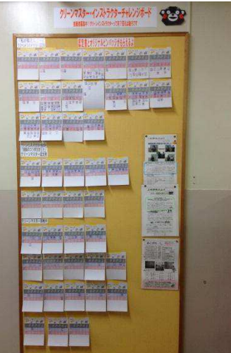
認定者もオリジナルピンバッジももらえるよ