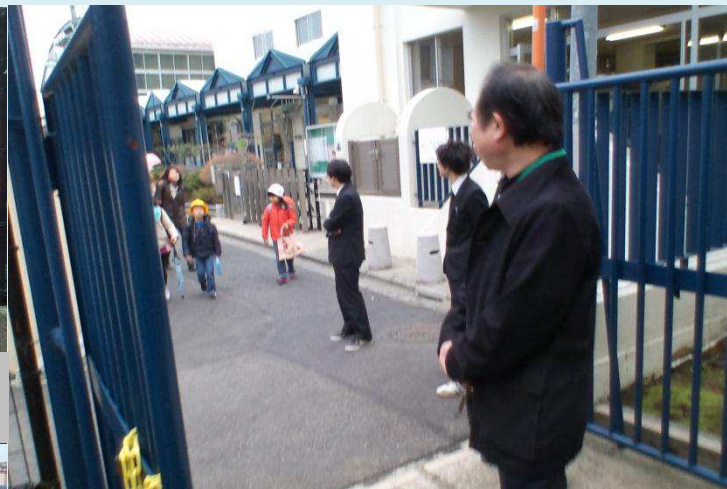
市ヶ谷小学校のみんなにも「おはようございます！」

社会に出て、一番役に立つのは、挨拶です。 面接でも、身についた挨拶か、今だけの挨拶かはすぐに相手に伝わるものです。あなたを助けてくれる挨拶を、3年間で身につけましょう。