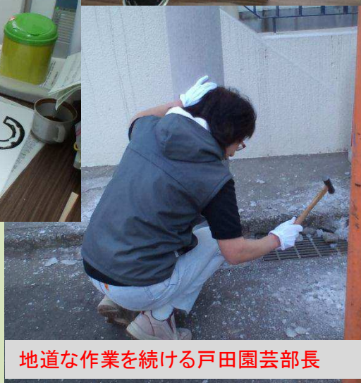
地道な作業を続ける戸田園芸部長