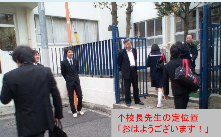
↑校長先生の定位置 「おはようございます！」