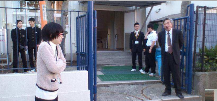
どんなに寒くても「おはようございます！」 でも清水生徒会長は半袖。