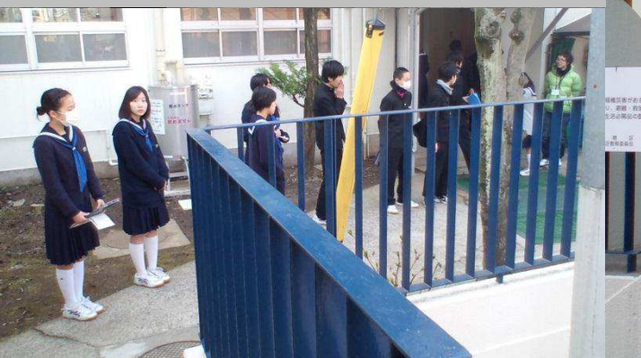
生活委員も全員集合で「おはようございます！」