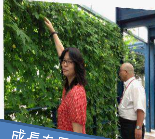
成長を見守る先生方