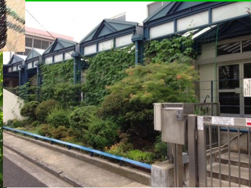
正門前は、主事室で育てています。とても涼しげです。