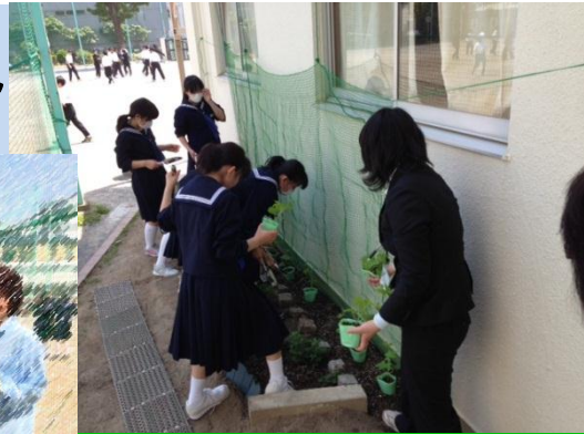
今年は多目的室の前に設置