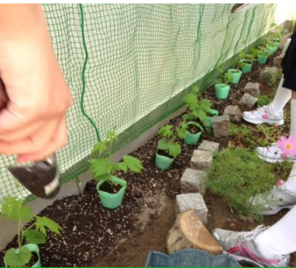
新宿区から支給されたゴーヤの苗