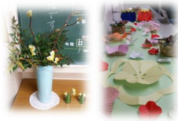
〈学校玄関正面〉〈下駄箱上部〉

目標に向かって努力することの大切さを、これからも教科指導や様々な教育活動の中で伝えてまいります。