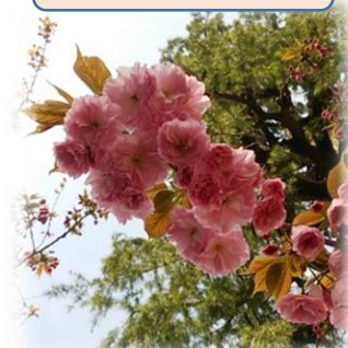
学校で咲いている花