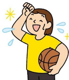
基本はしっかり汗をかくこと

毎日少しずつ1～2週間続けると体が暑さに慣れて、熱中症になりにくくなります(暑熱順化)