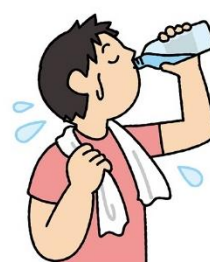
汗をかいたらこまめに水分補給