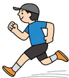
毎日、少しずつでも運動しよう