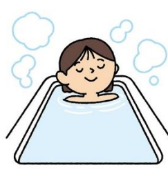
お風呂でしっかり湯船につかり