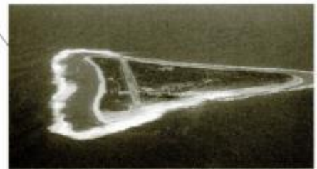
日本の東のはし、南鳥島(東京都)