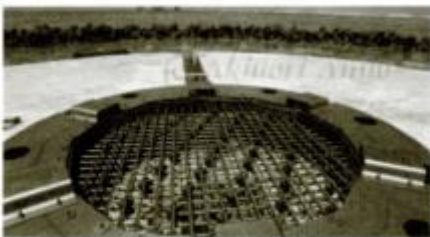
日本の南のはし、沖ノ島(東京都)