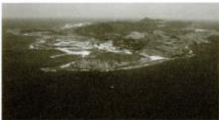
日本の西のはし、与那国島(沖縄県)