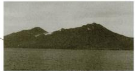
日本の北のはし、択捉島(北海道)