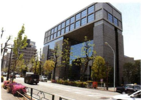
新宿コズミックセンター