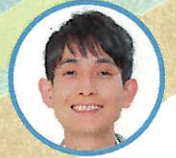
芸人・漫画家 矢部 太郎 氏