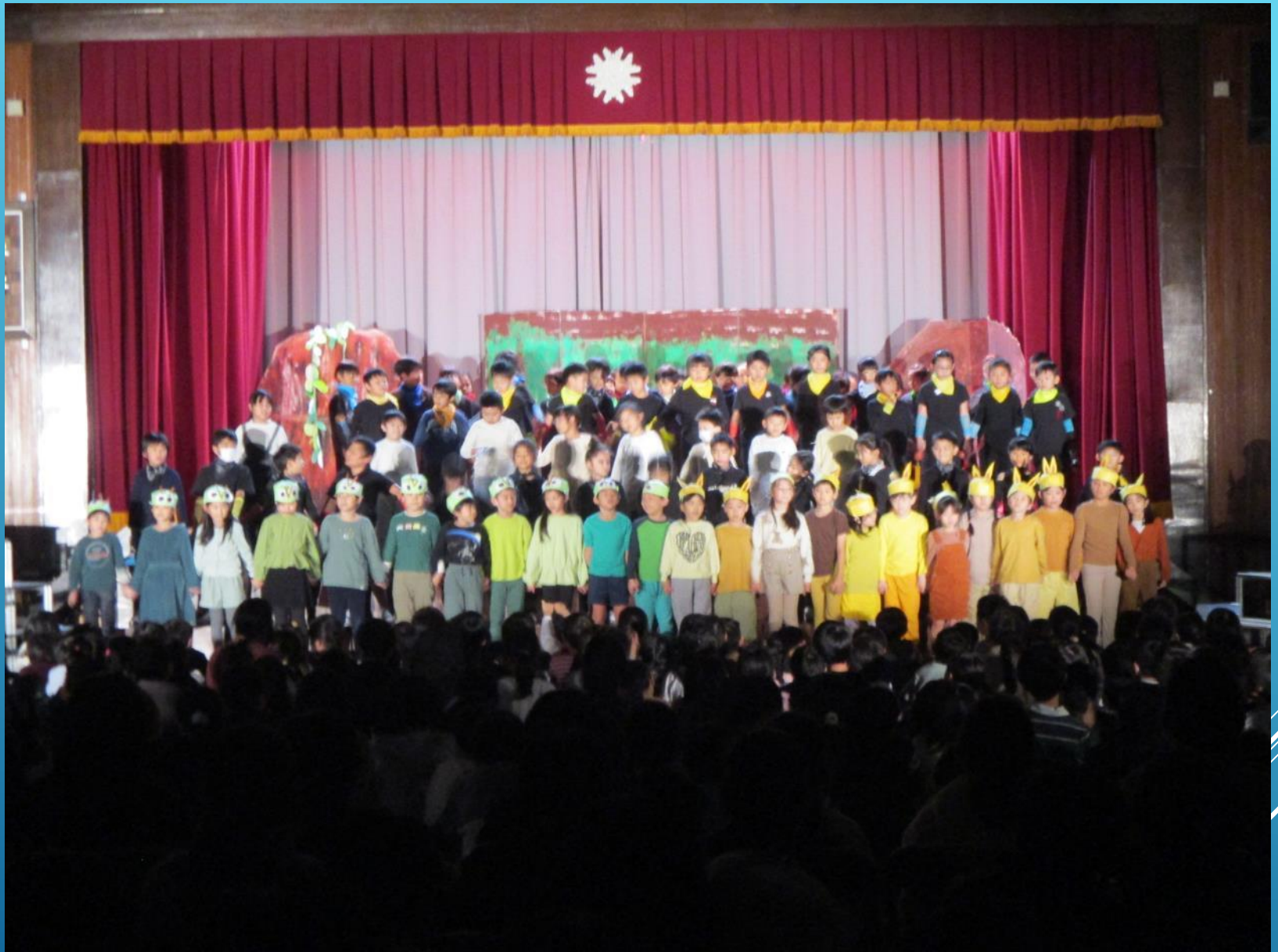
学芸会 2年 「ニンニンニンポウハラヘッタ」