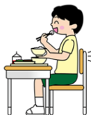
○食器を持ち姿勢よく食べる

しよつき も しよくじ しよつき も た 食器をきちんと持つことは、食事のマナーのひとつです。食器をきちんと持って食べる た ふせ りょうり た み め うつく み よ た かた と、食べこぼしを防ぎ、料理が食べやすくなります。見た目も美しく見えます。良い食べ方 み つ かてい しどう ねが を身に付けるようにしましょう。ご家庭でも指導をよろしくお願いいたします。