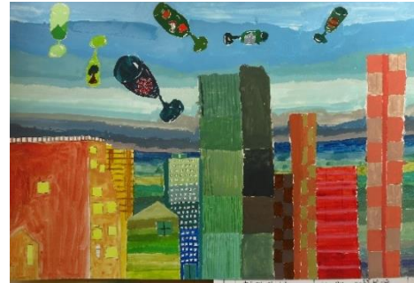
「カラフルワールド」 グラデーションを生かした6年の図工作品