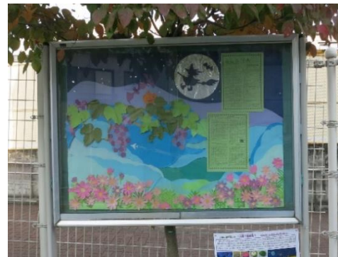
新宿門横の掲示板上にあります。

※和菓子は、季節を取り入れたものが多いです。季節の草花や果物、自然の様子をイメージしたものが見られます。同じ栗のイメージでも、様々なものがありそうです。他にはどんな和菓子があるか、見つけてみましょう。