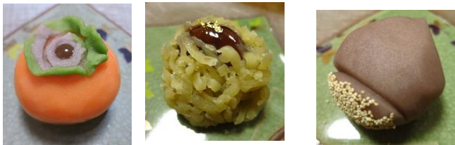
柿 いが栗 栗

※和菓子は、季節を取り入れたものが多いです。季節の草花や果物、自然の様子をイメージしたものが見られます。同じ栗のイメージでも、様々なものがありそうです。他にはどんな和菓子があるか、見つけてみましょう。