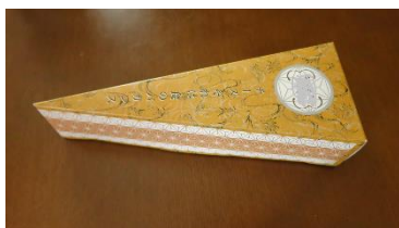
チーズのはこです。

① のりづけをしているところをみつけて、やぶかないように、そっと手でひらきます。かたいものは、むりにひらかず、おうちのかたに手つだっていただきます。