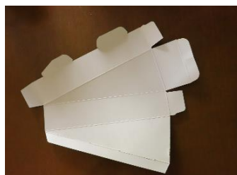
ひら 開いてみると・・・