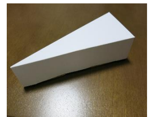
うらがえして元の形に 組み立てて。