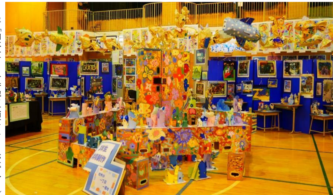
3年「柏木一丁目一番地」大型モニターが導入された際の段ボールで