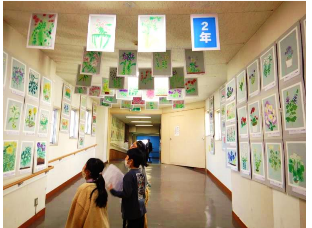
「2年生・3年生・4年生が描いた『春の花さいた』の花々に囲まれながら、展覧会場の柏木美術館へ」