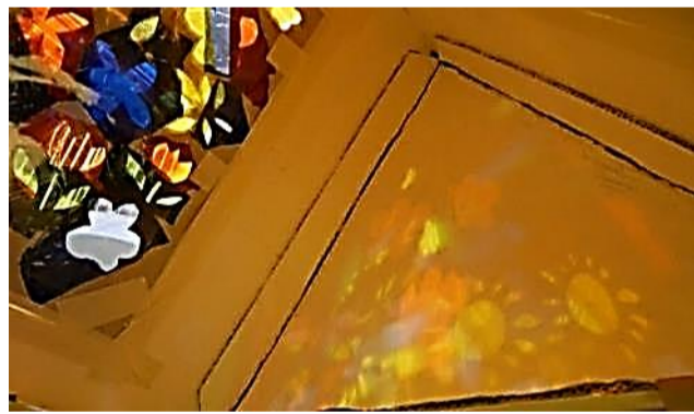
4年 段ボール箱再利用の光の部屋。テーブル・椅子・ベッドも使える。寝ると温かいベッドは避難所で使えると児童からの発案です。