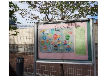
新宿門横の掲示板にあります。