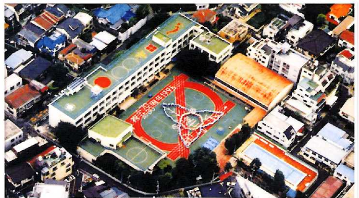
平成8年 開校70周年記念