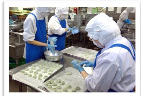
↑ よもぎ団子を作っている様子