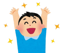
うれしいときいて♪