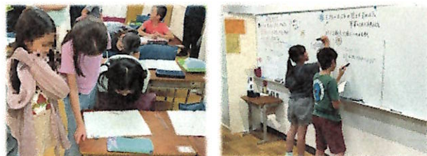
【6月に開催した研究授業の様子】

子どもたち自身が学習状況を捉え、学び方を選択し、学習課題を解決できるように、教職員一同、授業研究・授業改善に努めてまいります。