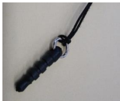
イヤホンジャック用