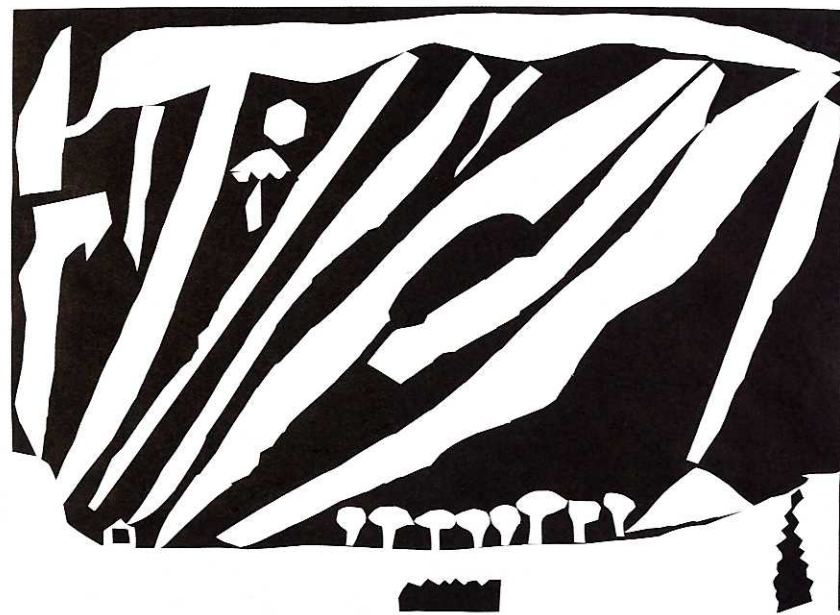
↑大きな かみなり [39×55cm/くろがようし, がようし]