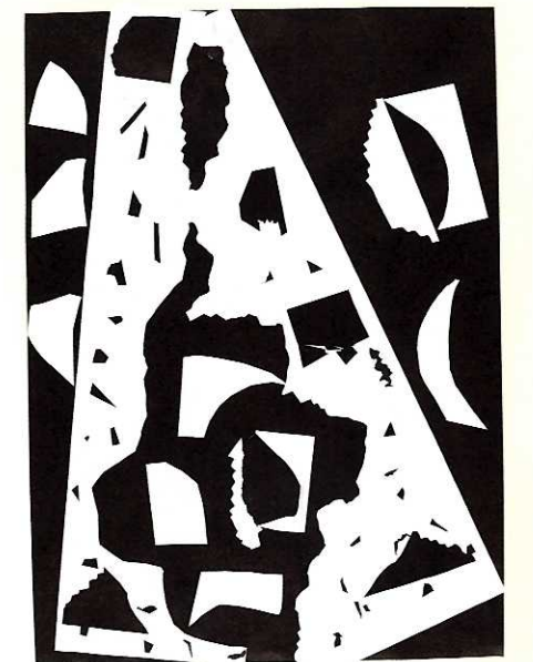
↑ゆめの 中 [56×39cm/くろがようし, がようし]

かみを ならべたら 左上に 大きな 人が 見えて きたよ。 大きな 人が ふしぎな いえに 入った ところを かいたよ。