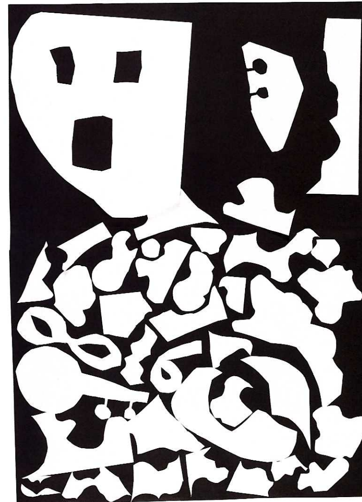
↑ [77×54cm/くろがようし, がようし]

かみを ならべたら 左上に 大きな 人が 見えて きたよ。 大きな 人が ふしぎな いえに 入った ところを かいたよ。