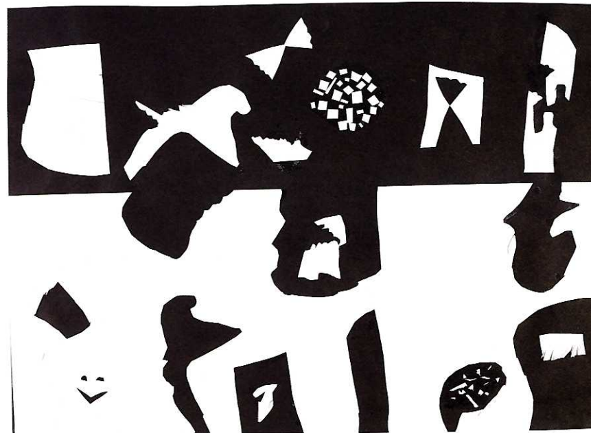
↑しあわせの くに [39×54cm/くろがようし, がようし]