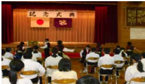
開校100周年 開園50周年 記念式典の様子

12月4日(土)は、開校100周年記念学芸会の保護者鑑賞日です。『動き出せ!誰もが輝く最高の時間!』のスローガンを意識し、子どもたちは限られた練習時間の中、大きな声でセリフを言ったり友達と動きを合わせたりして、みんなで一つの作品を作り上げようと頑張ってきました。当日は役になりきって演じる姿が見られることと思います。子どもたちの頑張りには大きな拍手を送っていただきますよう、お願い申し上げます。