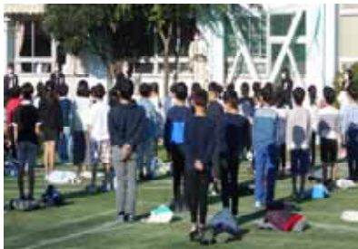
開校100周年記念 児童集会の様子

快晴の空の下、11月6日(土)に開校100周年・開園50周年記念式典が行われました。朝は全児童が校庭で記念集会を、その後の記念式典では6年生と幼稚園5歳児きりん組の園児が代表で参加しました。金管バンドの児童の演奏曲をBGMにご来賓の皆様が入場し、和太鼓クラブの児童による「三宅太鼓」、そして6年生児童による「さくら さくら」の箏演奏がありました。どの子も一生けんめいに演奏し記念式典に花を添えました。また、「よるこびの言葉」では6年生が立派な呼びかけをするとともに、幼稚園5歳児きりん組の子たちもかわいらしい動きをつけながら元気よく園歌を歌いました。3密を避けるため参加者を限定し、感染防止対策を講じての記念式典でしたが、厳粛な中にも心温まる記念式典を行うことができました。保護者の皆様、地域の皆様には多大なるご理解とご協力を賜り、感謝申し上げます。ありがとうございました。