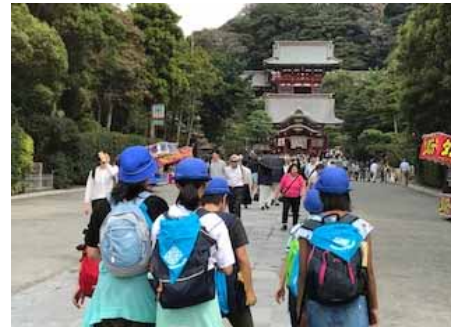
館山移動教室よりの鶴岡八幡宮でのグループ行動

鎌倉の歴史と館山の自然を体感した3日間。協力することの大切さを学んだ3日間でもありました。一回り成長した6年生の今後の活躍が楽しみです。