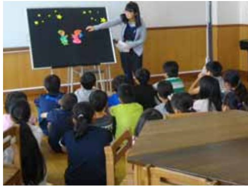
学校図書館支援員による パネルシアターの様子

今年度も、子どもたちに学校図書館をたくさん利用してもらいたいと考えています。そこで、以下のようなイベントを企画しました。読書にぴったりの季節ですから、一冊でも多くの本を読んでほしいです。