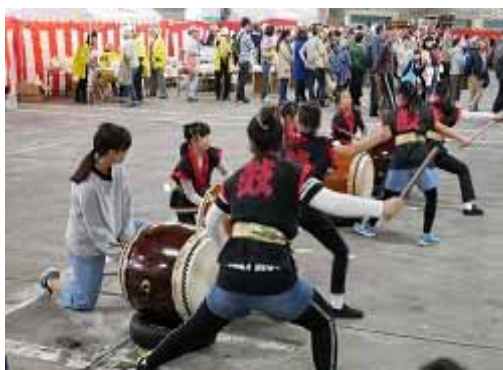
市場祭りで演奏する 和太鼓クラブの児童