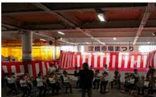
淀橋市場まつりで演奏する淀四金管バンド

学校のルールを基に「家庭ルール」を決めていただき、守っていくことが子どもの「自律」につながると思います。