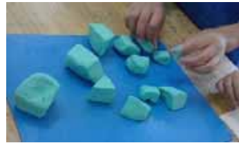
ひもで切った粘土

これからも「いいこと思いついた!」という声がたくさん聞こえる授業を目指していきます。