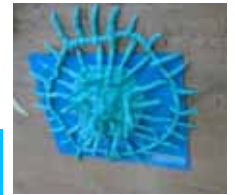
いろいろなものができました。