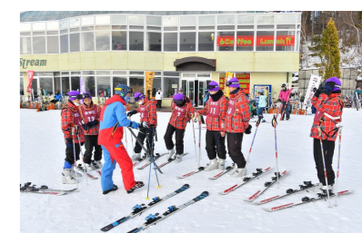
女神湖スキー移動教室