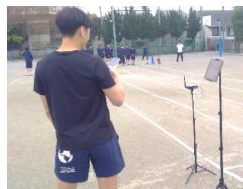
スピードアップアカデミー