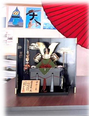
正面玄関に展示中