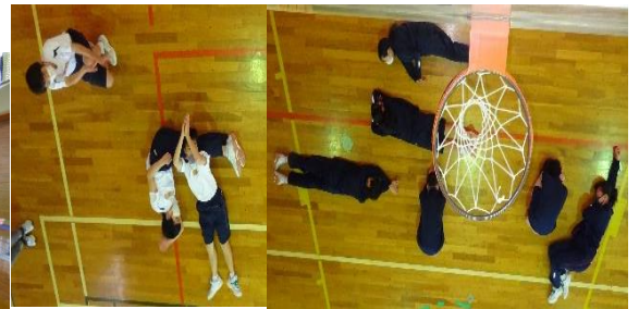
↑人文字「カーテン」は斬新な表現…！