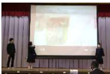
Team "So Shiny" Which do you like better, giving or receiving things?