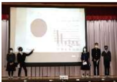
Team "Fingers" What's your favorite kind of movie?