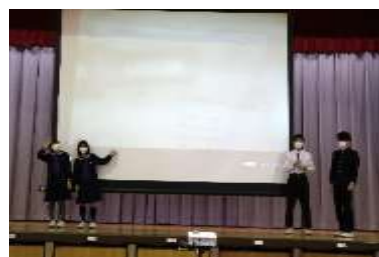
Team "おむすびころりん" What's your favorite riceball filling?