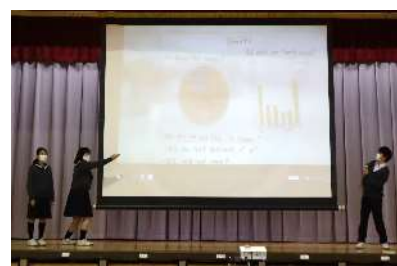
Team "※米しるし" What's your favorite sweet?