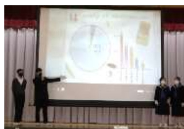
Team "Carrot" What's your favorite convenience store?