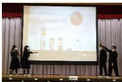
Team "We can fly!" What's your favorite country?