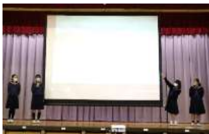
Team "Grape" Who's your favorite artist?

英語の授業では、Unit6で学んだ「比較級の表現」を活用しながら、発表を行いました。場所は体育館を使いました。グループで協力し合いながら、英語でアンケートの質問を聞いたり、それに答えたりした結果をグラフにまとめ、発表しました。準備時間が少なかったにもかかわらず、どのグループも堂々と素晴らしい発表を披露することが出来ました。