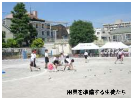
用具を準備する生徒たち

たとえば用具係は、各競技で使用する道具を所定の場所に配置する役割です。取り扱う道具も多種多様で、行動範囲も広く大変な仕事ではありますが“縁の下の力持ち”として運動会を支えています。