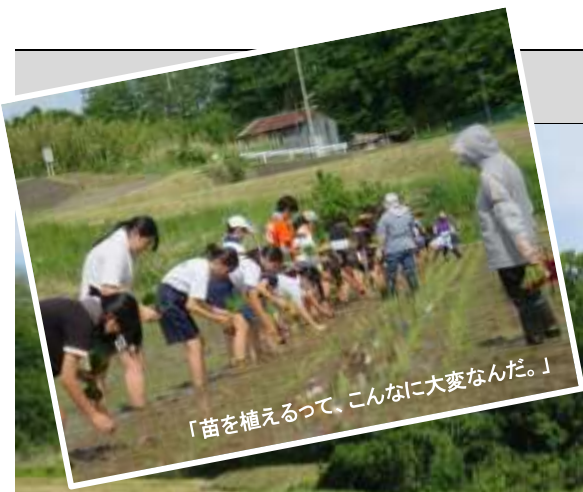
令和8年5月31日 女神湖移動教室での田植え体験(1年生)

令和8年5月31日(日)から6月2日(火)までの2泊3日間、1年生は、長野県立科町にある新宿区立女神湖高原学園にて寝食を共にし、様々な経験を積んできました。何事にも真剣に取り組む姿に感激する日々でした。