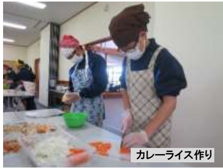
カレーライス作り

令和8年5月31日(日)から6月2日(火)までの2泊3日間、1年生は、長野県立科町にある新宿区立女神湖高原学園にて寝食を共にし、様々な経験を積んできました。何事にも真剣に取り組む姿に感激する日々でした。