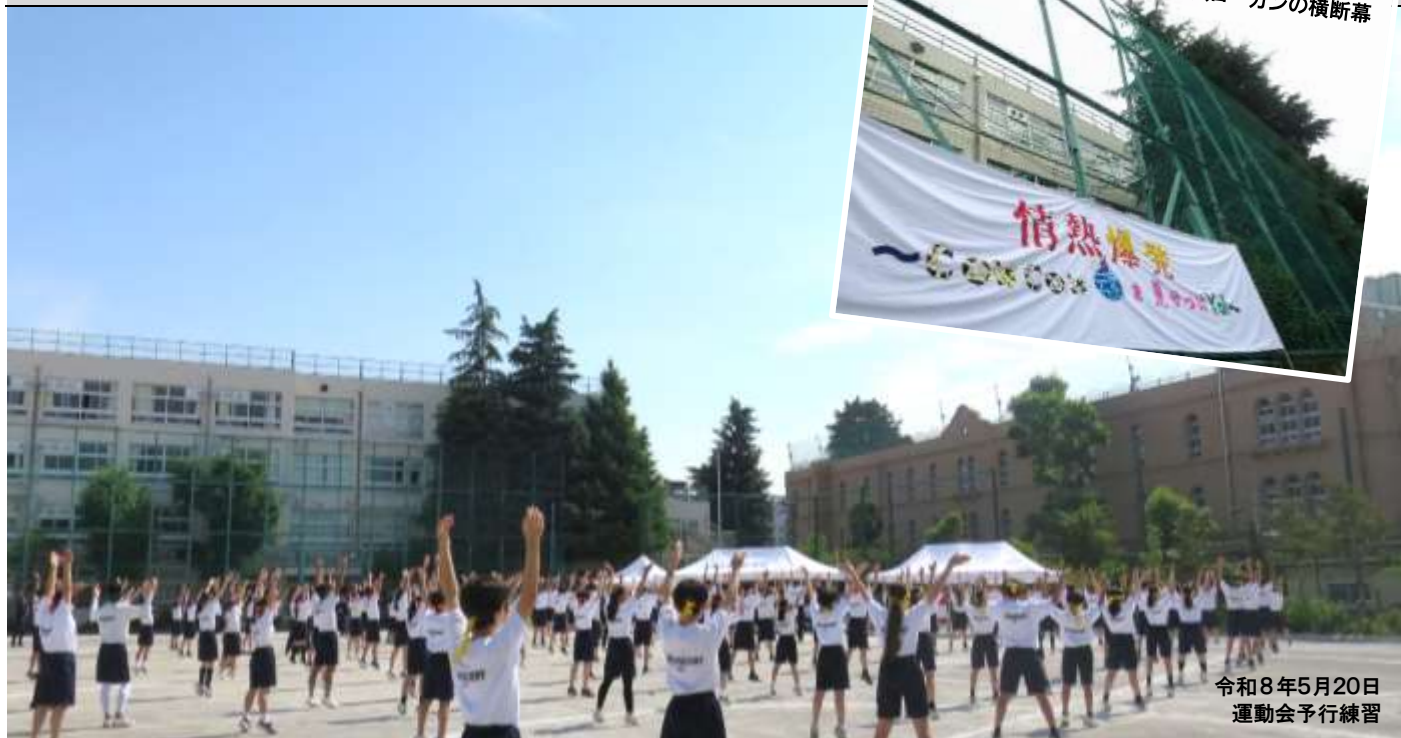
令和8年5月20日 運動会予行練習

令和8年5月23日(土)、例年とは異なった形で運動会を実施しました。昨年度から有志の生徒によるプロジェクトチームを発足し、「ガチ勢」も「エンジョイ勢」も、運動が得意な人も苦手な人も、誰もが達成感を味わうことができる運動会を目指して検討を重ねてきました。つまり今年は、「自分たちがやりたい“運動会”」を目指し、生徒たちが主体的に考え形にすることが出来ました。前例踏襲ではなく、新しい運動会の誕生です。