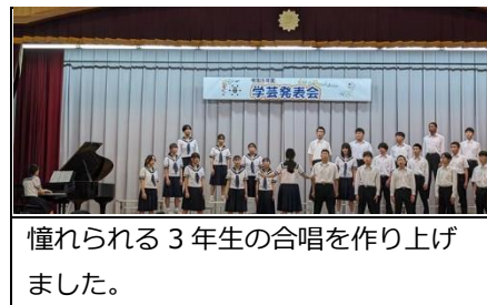
憧れられる3年生の合唱を作り上げました。

10月21日(土)に学芸発表会が行われました。今年から4年ぶりに、総合的な学習の時間の発表が復活しました。限られた時間の中で、楽しそうに合唱の練習や舞台の練習に取り組む生徒たちの姿を見ることができました。