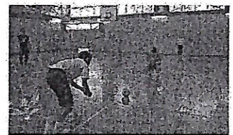
ブラインドサッカー

ようになり、ブラインドサッカーで、言葉で物事を伝えるときには伝える側・聞く側の姿勢が重要であることを、体験を通して学んだ3年生。人は経験や体験から多くのことを学びます。今回、それぞれが経験したことは、無意識のうちに自身の力となってこれから先の人生で役立つ時が来ると思います。多くの経験は、力となって蓄えられます。10月